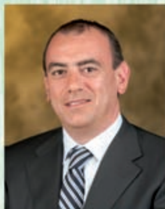
Sindaco e Assessore ai Servizi Sociali ed Edilizia Privata