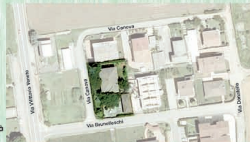
L'area dove sorgerà il nuovo asilo nido

La realizzazione dell'Asilo Nido è assistita da finanziamento della Regione Lombardia pari a € 245.000 a fondo perso. La rimanente quota per la sistemazione delle aree a verde e per l'adeguamento della viabilità locale, pari ad € 100.000 sarà a carico del comune